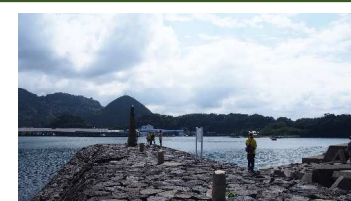
恵美須ヶ鼻造船所跡

恵美須ヶ鼻に造船所を設置し、洋式軍艦の建造を試み、藩初の洋式木造帆船「丙辰丸」、2隻目の「庚申丸」をこの造船所で建造しました。現在も当時の規模の大きな防波堤が残っています。